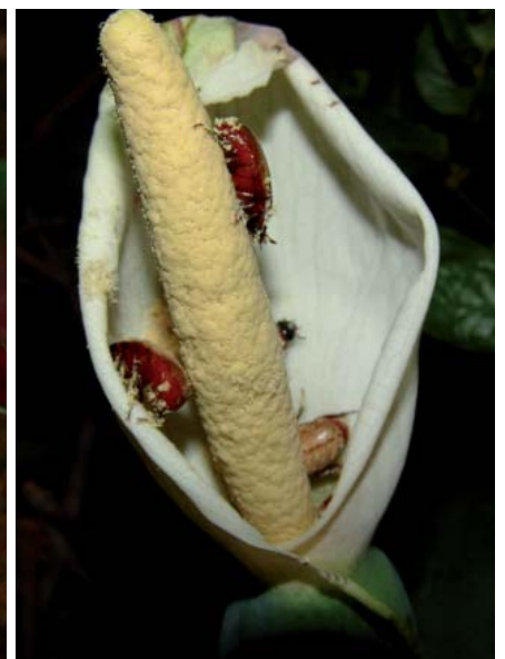
Le Chevalier rouge est réputé pour ses feuilles tachées de rouge et blanc. À droite, plusieurs Cyclocephala sp. couverts de pollen sortant d'une inflorescence de cette plante - Clichés A. Maia.