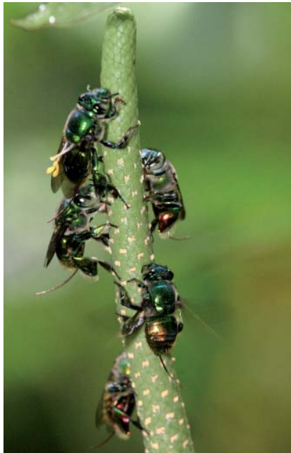
Abeilles euglossines ( Euglossa piliventris ) arpentant une inflorescence d' Anthurium sagittatum

sines (voir plus loin). Les Trigona se posent sur les inflorescences et récoltent du pollen, émis en abondance, qu'ils transportent d'une inflorescence à l'autre, assurant la pollinisation. En fin de matinée il n'y a presque plus de pollen.