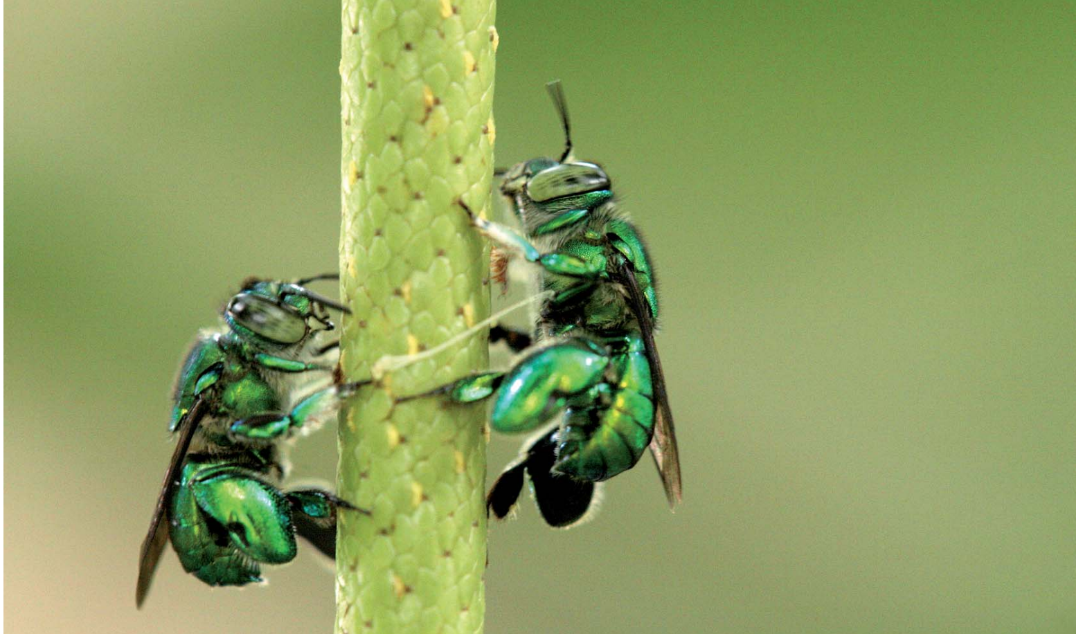
Un Anthurium ( Anthurium thrinax) et ses pollinisateurs ( Euglossa cf. hemichlora)