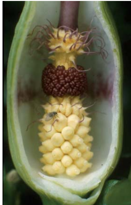
Au matin du deuxième jour de sa floraison, les pollinisateurs du gouet d'Italie sont retenus prisonniers à l'intérieur de la chambre florale par les poils stériles - Cliché M. Chartier. À droite, Psychoda sur un spadice d' Arum maculatum - Cliché Anita Diaz, Université de Bournemouth (Royaume-Uni)

pollen, il sera déposé sur les fleurs femelles, qui sont alors réceptives. Les insectes restent dans l'inflorescence jusqu'au soir du lendemain, où se produit un deuxième pic de chaleur et d'odeur, accompagné de l'émission de filaments de pollen collant par la partie supérieure de l'axe florifère. Les Coléoptères mettent une à deux heures pour quitter l'inflorescence, emportant avec eux du pollen. Le moment où les ils s'envolent d'une inflorescence pollinisée coïncide parfaitement avec l'heure à laquelle les nouvelles inflorescences sont prêtes à les accueillir.